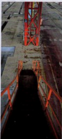
Nella parte alta dei capannoni si trovavano degli uffici, ai quali si accedeva con scale anguste (qui sopra); nei sotterranei, invece, passavano i camion per svuotare le vasche dai liquidi di scolo

Consumato il pasto, si tornava al reparto, ognuno al pro-